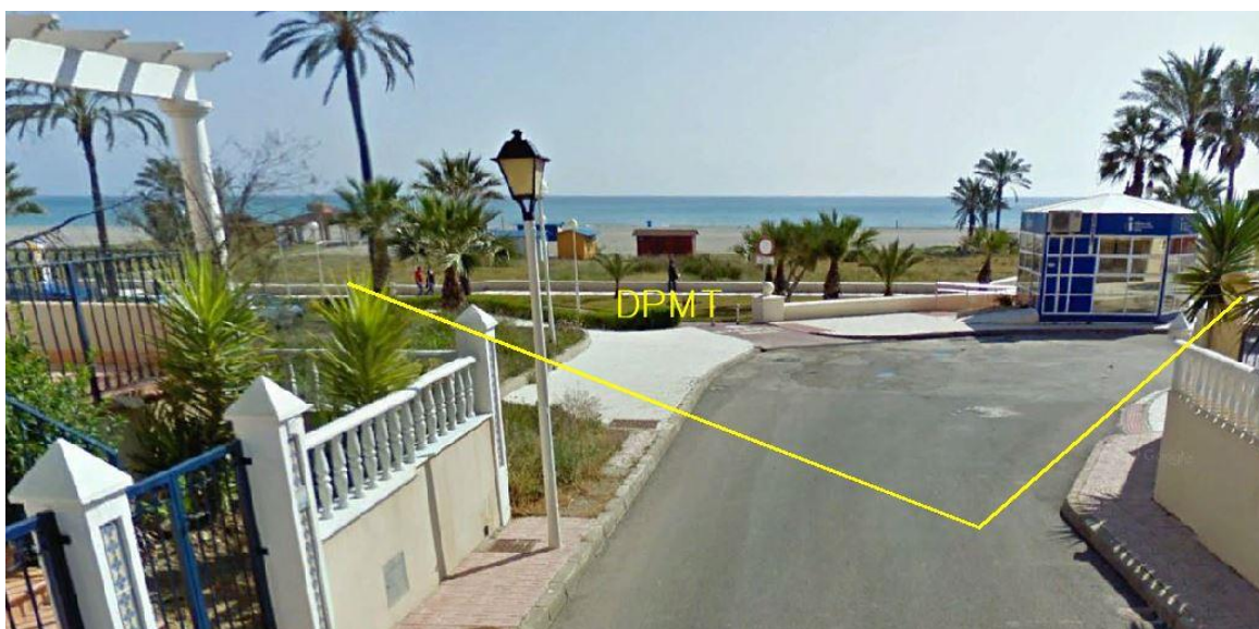
Fotografía 4. Deslinde del DPMT entre los vértices M-12 y M-15.