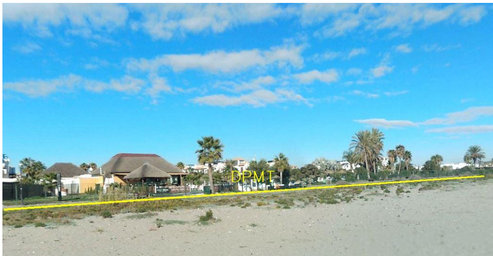
Fotografía 18. Deslinde del DPMT entre los vértices M-65 y M-67. Elaboración propia.