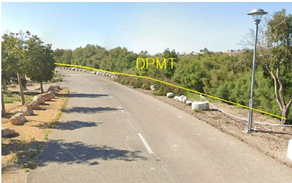
Fotografía 7. Deslinde del DPMT entre los vértices M-28 y M-29.