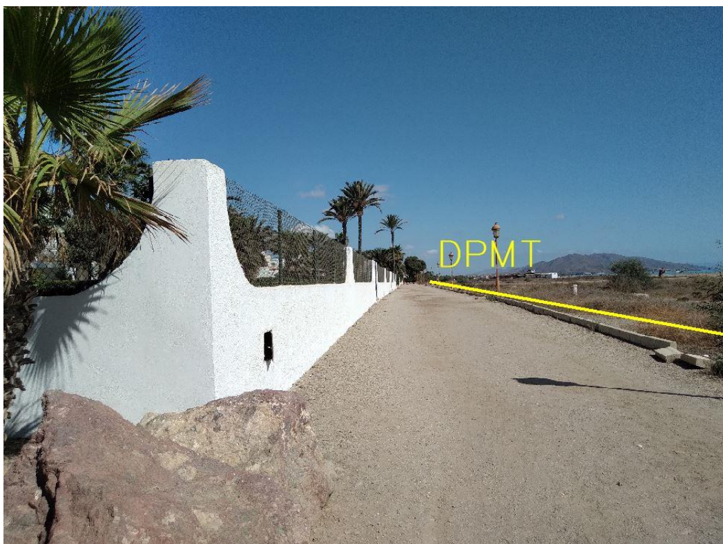
Fotografía 11. Deslinde del DPMT entre los vértices M-32 y M-33.