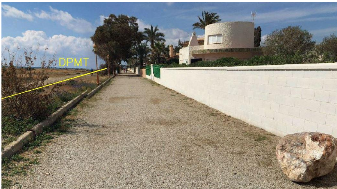
Fotografía 12. Deslinde del DPMT entre los vértices M-35 y M-36.