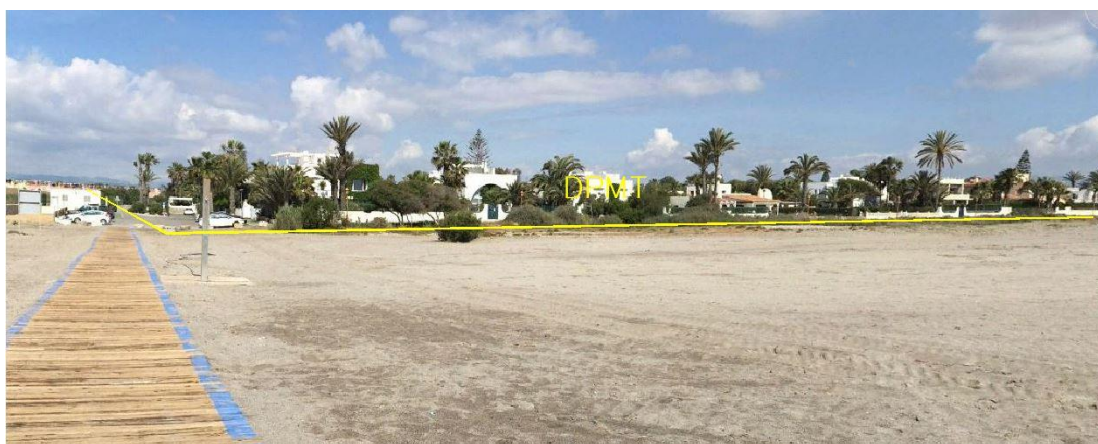
Fotografía 9. Deslinde del DPMT entre los vértices M-31 y M-34.