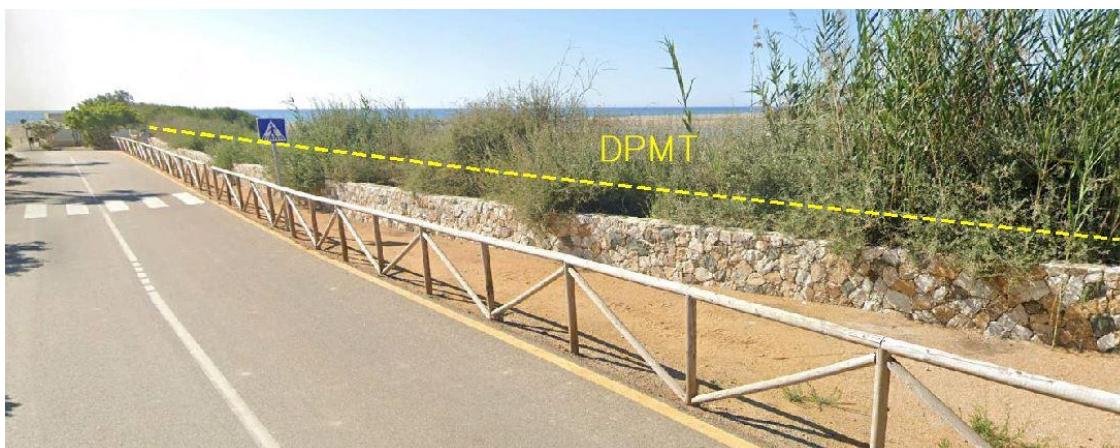
Fotografía 8. Deslinde del DPMT entre los vértices M-30 y M-31.