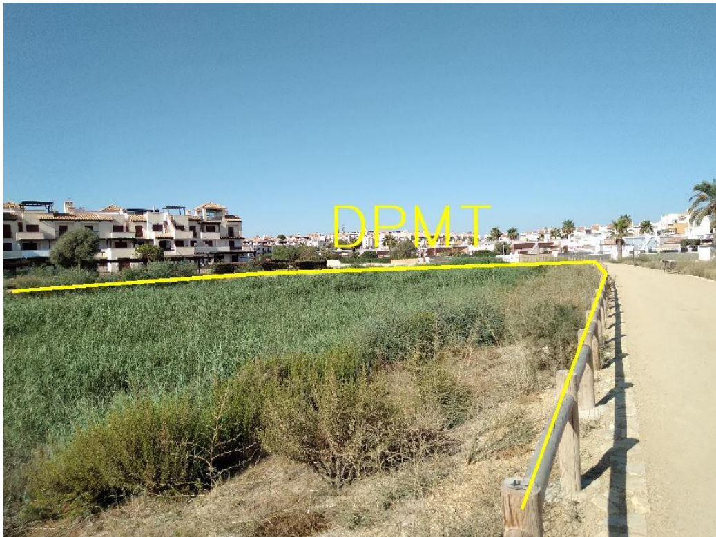
Fotografía 21. Deslinde del DPMT entre los vértices M-70 y M-78.