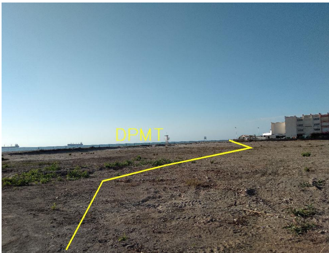
Fotografía 30. Deslinde del DPMT entre los vértices M-117 y M-121.