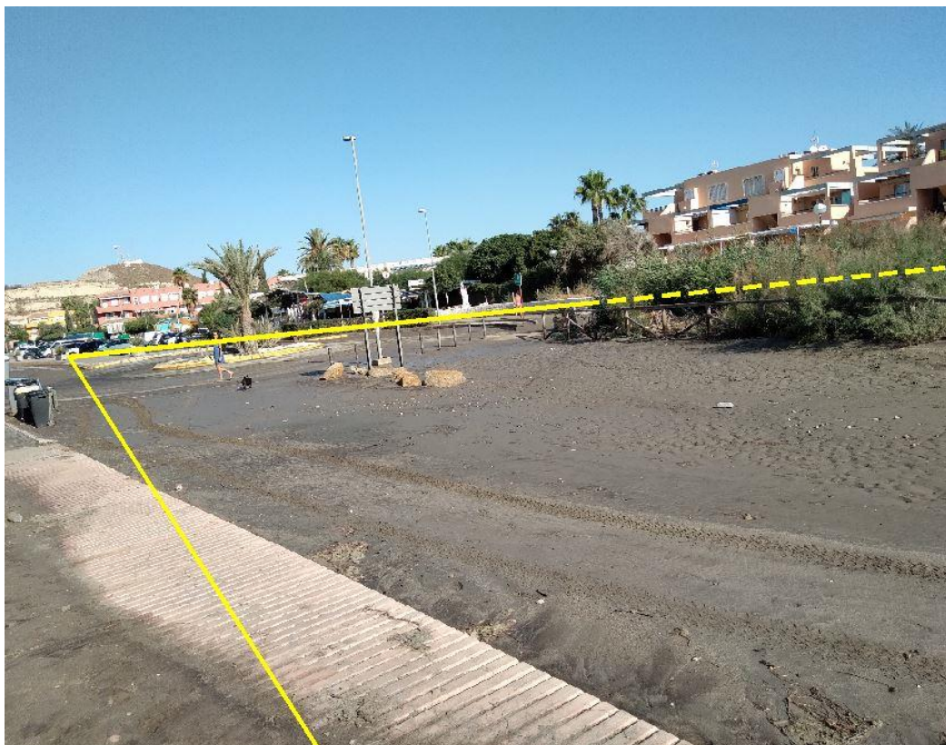
Fotografía 26. Deslinde del DPMT entre los vértices M-91 y M-93.