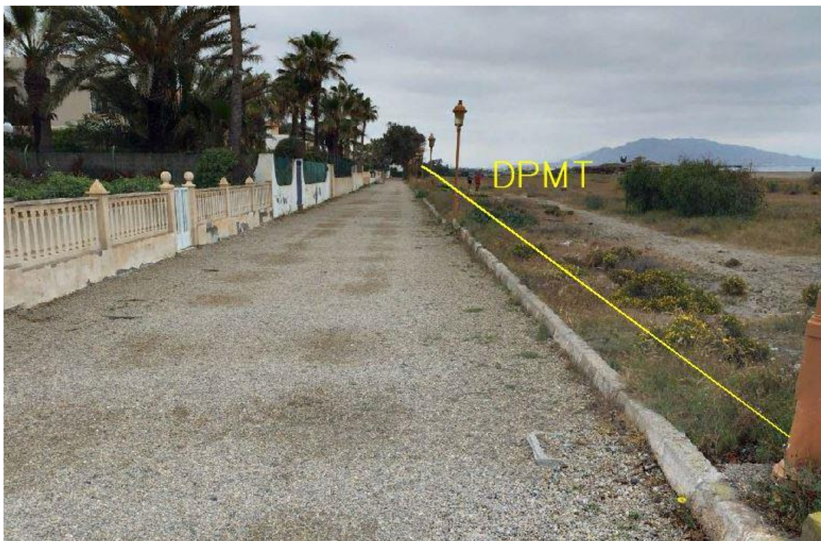
Fotografía 10. Deslinde del DPMT entre los vértices M-32 y M-33.