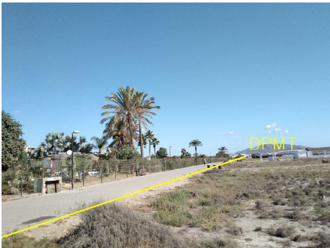
Fotografía 19. Deslinde del DPMT entre los vértices M-65 y M-67.