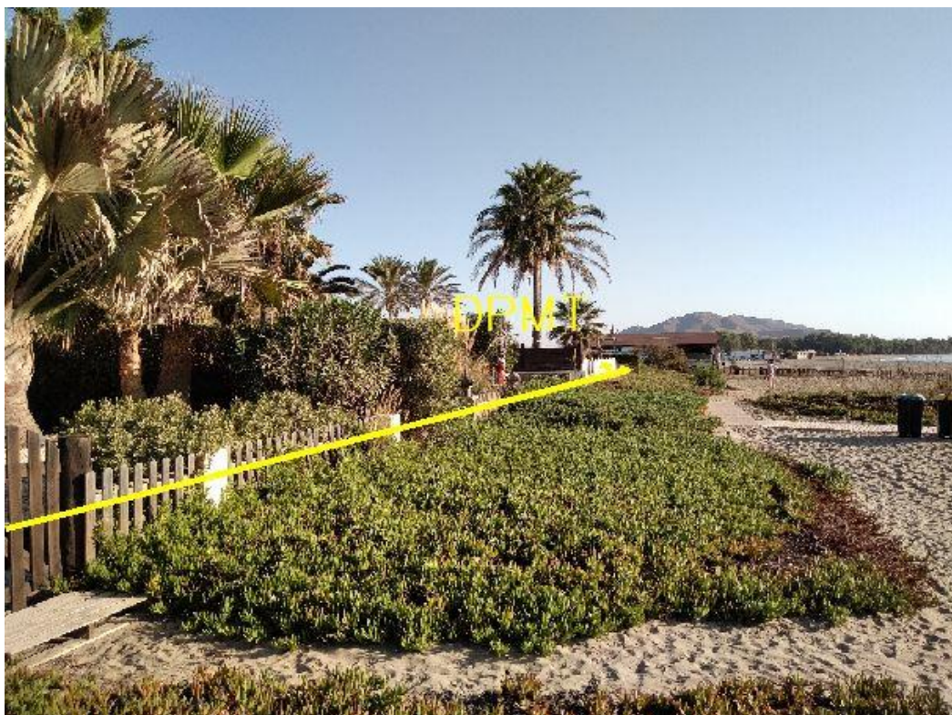
Fotografía 33. Deslinde del DPMT entre los vértices M-124 y M-126.