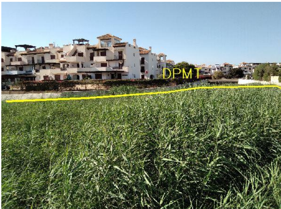
Fotografía 22. Deslinde del DPMT entre los vértices M-71 y M-78.