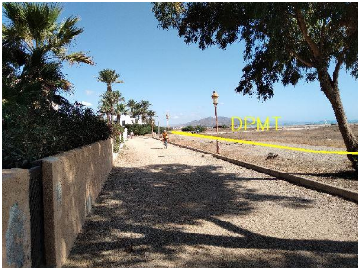
Fotografía 13. Deslinde del DPMT entre los vértices M-35 y M-37.