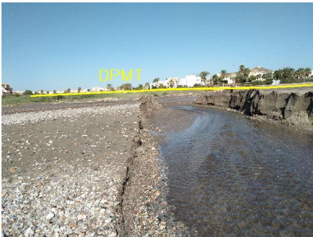
Fotografía 23. Deslinde del DPMT entre los vértices M-73 y M-78.