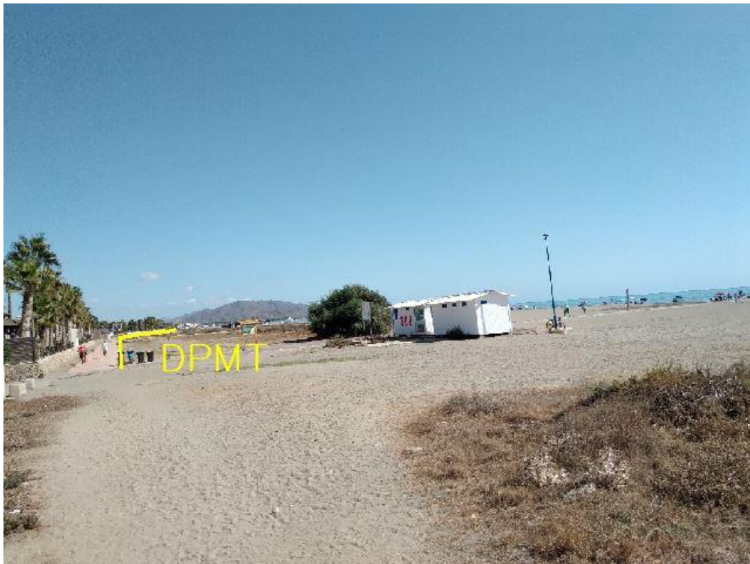
Fotografía 16. Deslinde del DPMT entre los vértices M-46 y M-48.