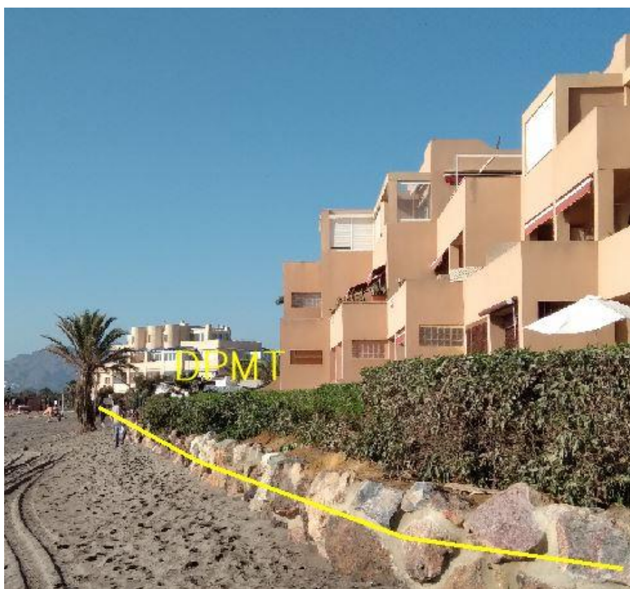
Fotografía 28. Deslinde del DPMT entre los vértices M-100 y M-102.