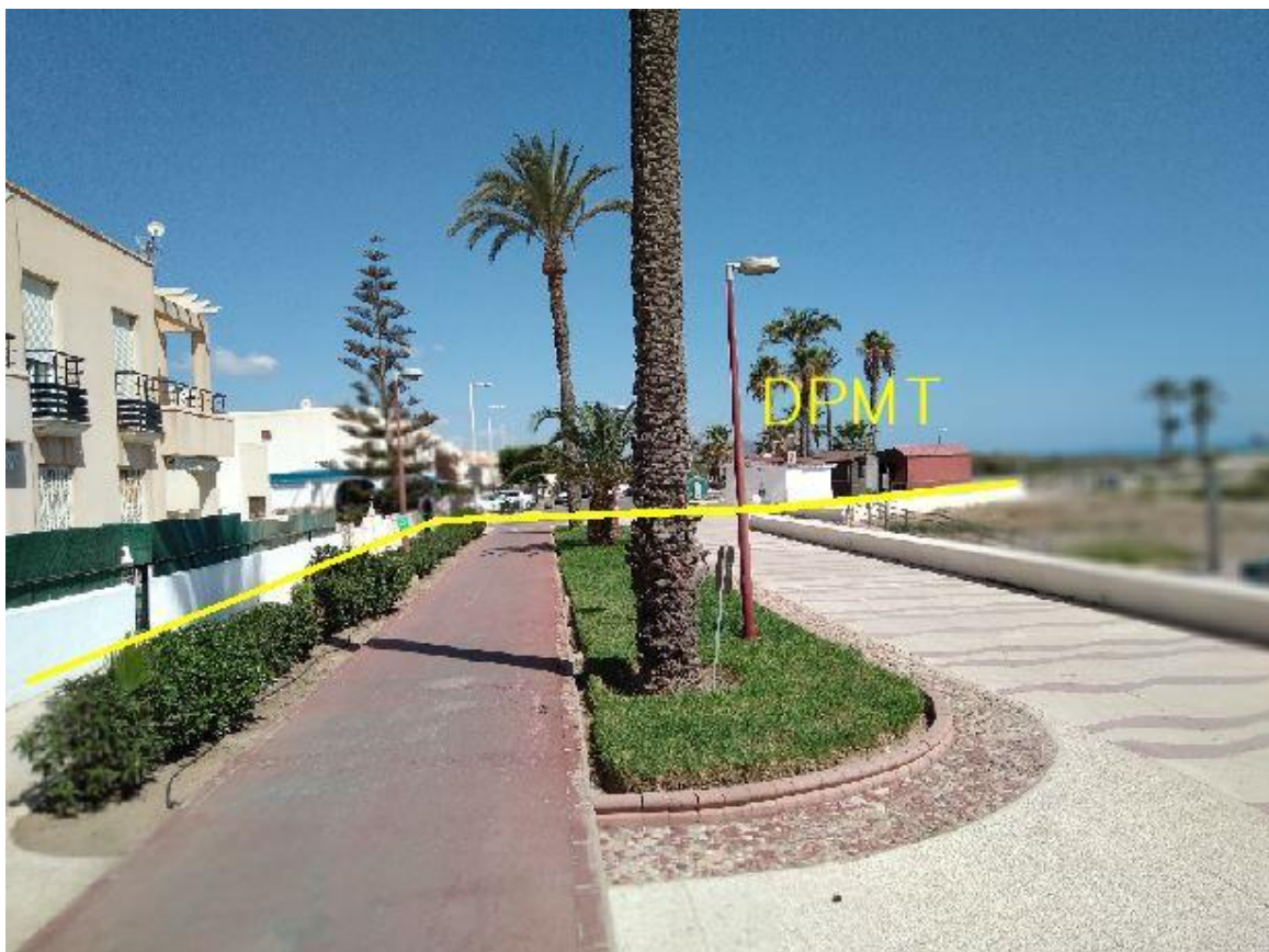
Fotografía 3. Deslinde del DPMT entre los vértices M-11 y M-12.