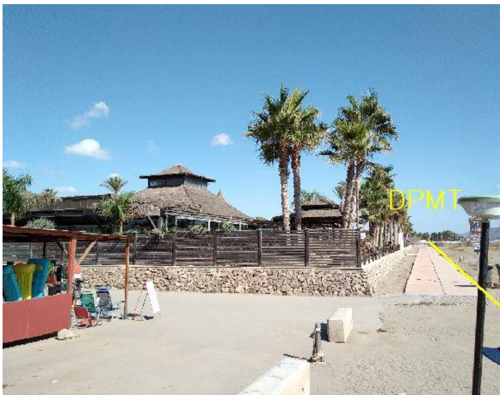
Fotografía 15. Deslinde del DPMT entre los vértices M-46 y M-47.