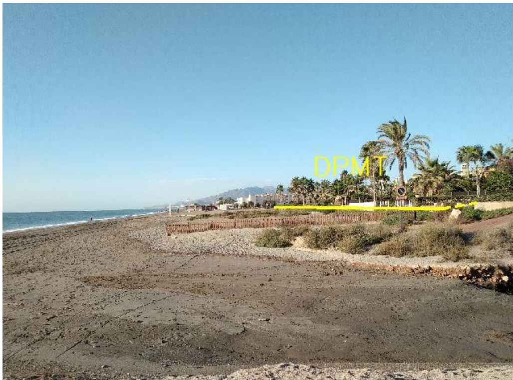
Fotografía 34. Deslinde del DPMT entre los vértices M-123 y M-126.

En estas fotografías sobre el terreno y en las fotografías del visor de Google Earth, la representación de los límites del dominio público marítimo-terrestre han de tomarse como una aproximación, dado que son fotografías en perspectiva y, por tanto, no georreferenciadas. Se trata de mostrar, de la forma más aproximada posible, las delimitaciones mencionadas para una mejor comprensión por parte de los interesados.