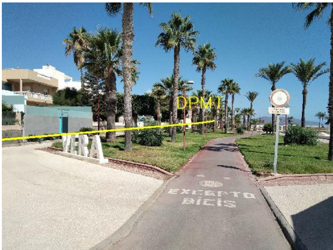
Fotografía 1. Deslinde del DPMT entre los vértices M-1 y M-3.