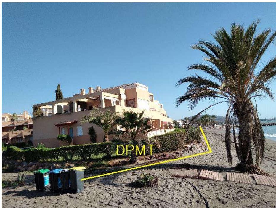
Fotografía 27. Deslinde del DPMT entre los vértices M-99 y M-101.