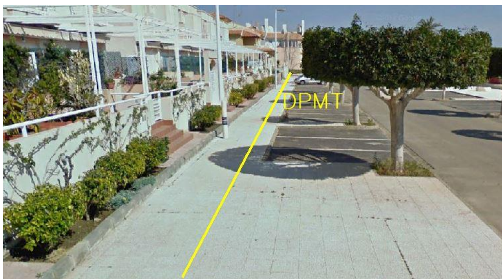
Fotografía 2. Deslinde del DPMT entre los vértices M-4 y M-5.