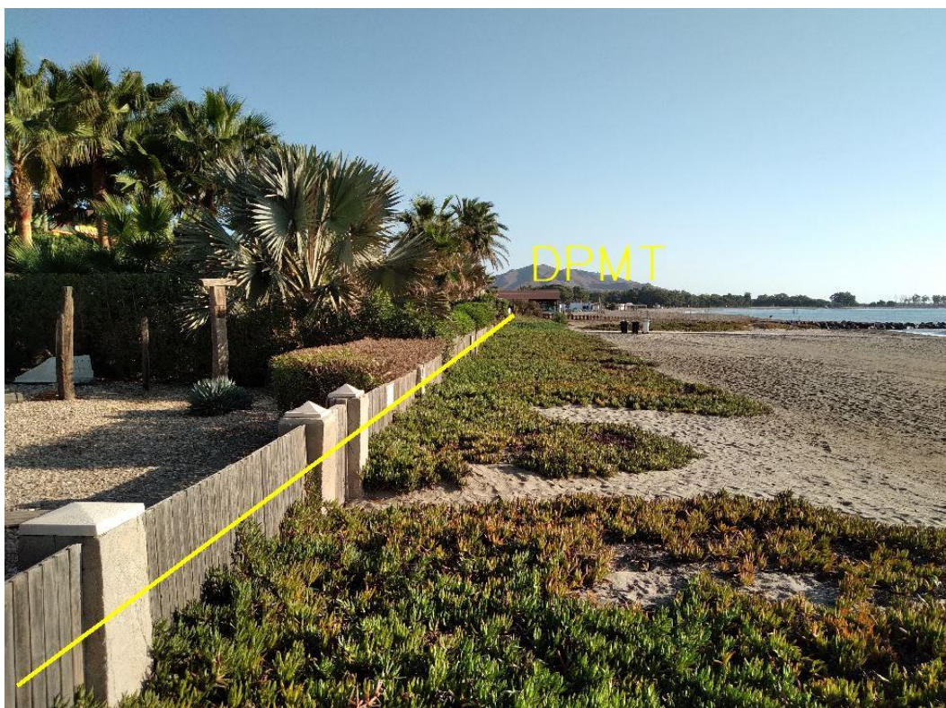
Fotografía 31. Deslinde del DPMT entre los vértices M-124 y M-125.