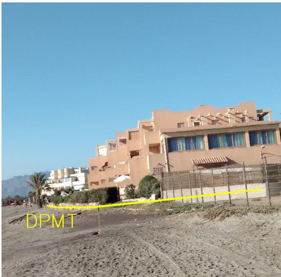
Fotografía 29. Deslinde del DPMT entre los vértices M-100 y M-102.