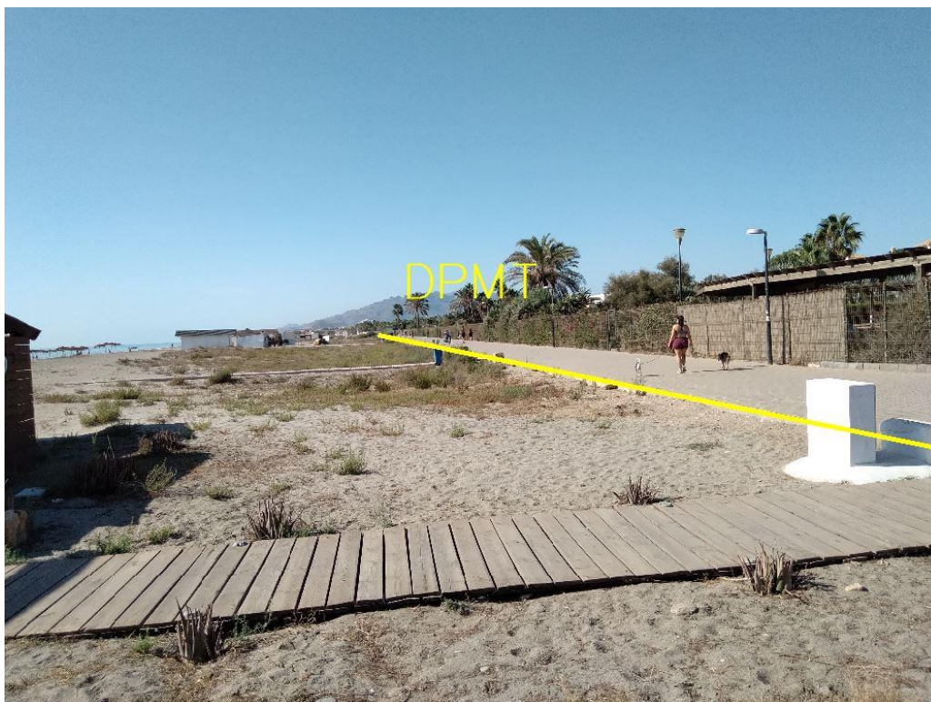
Fotografía 17. Deslinde del DPMT entre los vértices M-59 y M-61.