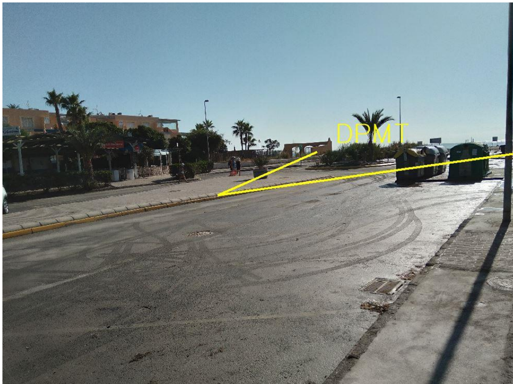
Fotografía 25. Deslinde del DPMT entre los vértices M-91 y M-93.