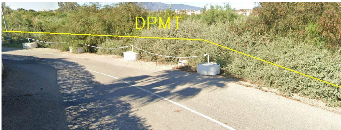
Fotografía 6. Deslinde del DPMT entre los vértices M-26 y M-27.