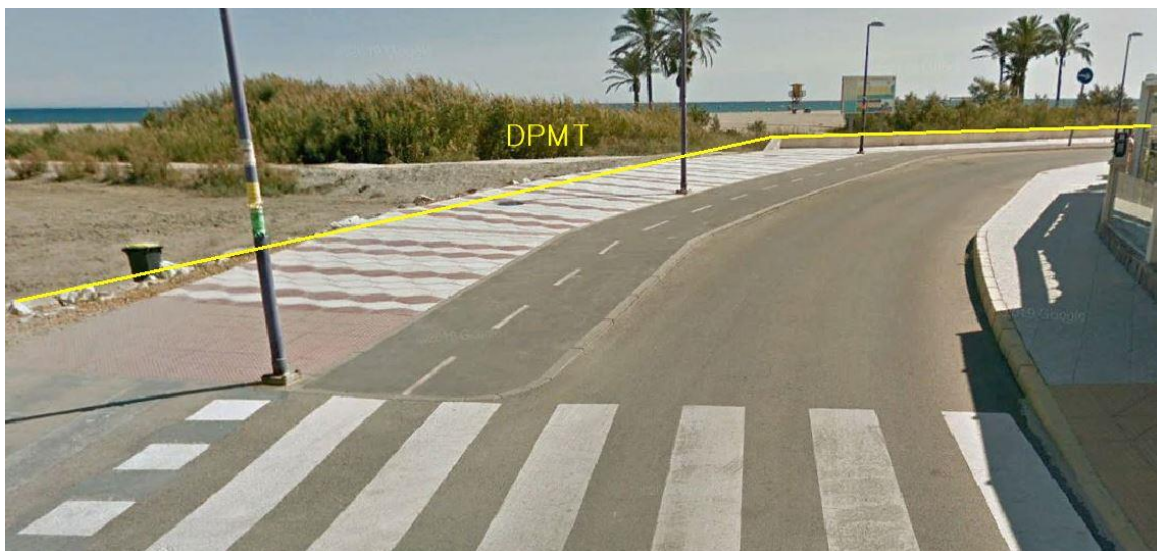
Fotografía 5. Deslinde del DPMT entre los vértices M-16 y M-18.