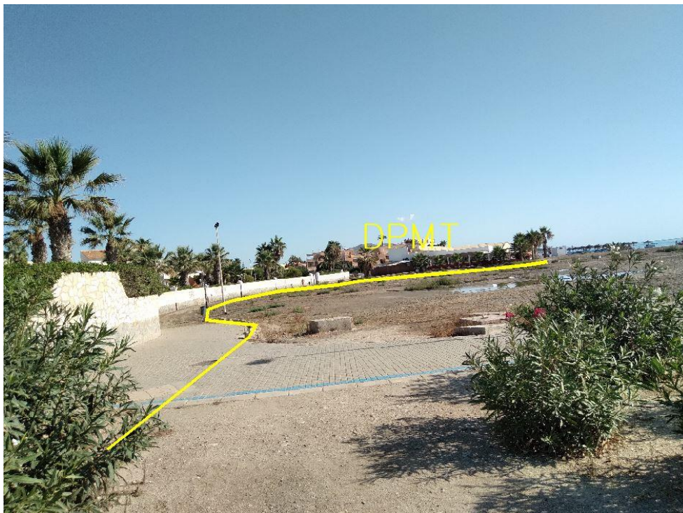
Fotografía 24. Deslinde del DPMT entre los vértices M-84 y M-89.