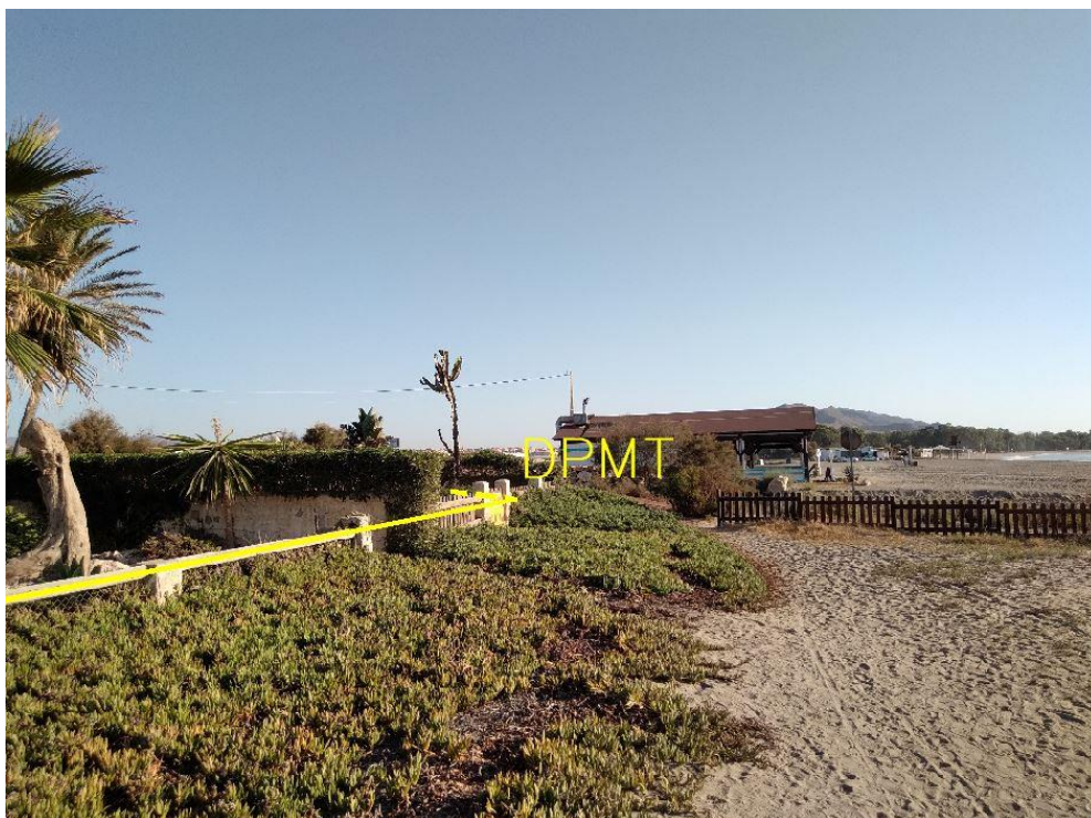
Fotografía 32. Deslinde del DPMT entre los vértices M-125 y M-126.